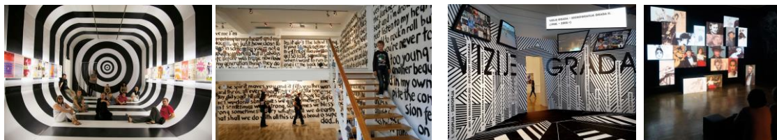
Studio Rašić Vrabec