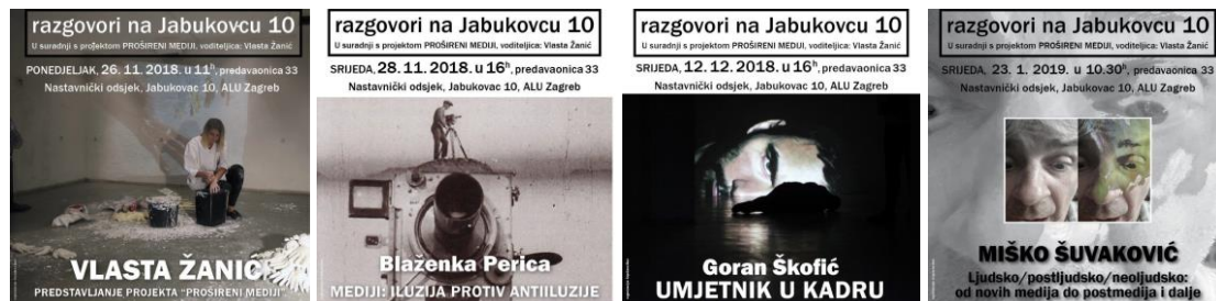
Plakati za predavanja i prezentacije